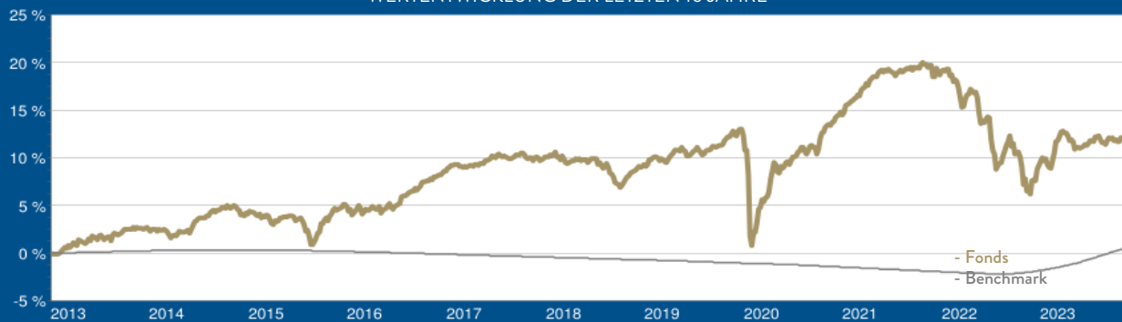
WERTENTWICKLUNG DER LETZTEN 10 JAHRE

Laufende Kosten (TER): 0,75 % per 30.09.2022