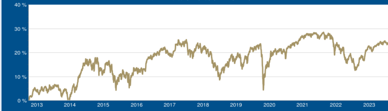
WERTENTWICKLUNG SEIT AUFLAGE