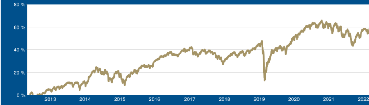
WERTENTWICKLUNG DER LETZTEN 10 JAHRE