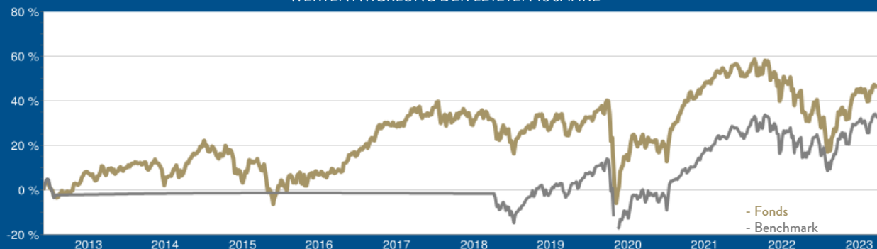
WERTENTWICKLUNG DER LETZTEN 10 JAHRE

Laufende Kosten (TER): 1,27 % per 30.09.2022