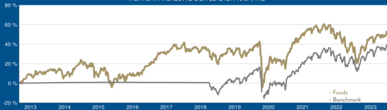
WERTENTWICKLUNG DER LETZTEN 10 JAHRE

Laufende Kosten (TER): 1,27 % per 30.09.2022