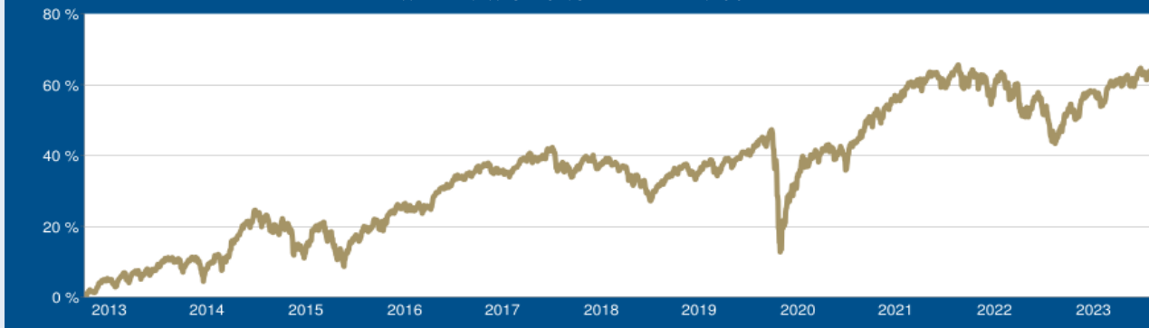
WERTENTWICKLUNG DER LETZTEN 10 JAHRE