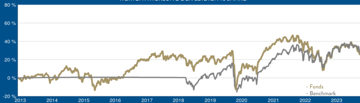
WERTENTWICKLUNG DER LETZTEN 10 JAHRE

Laufende Kosten (TER): 1,27 % per 30.09.2022