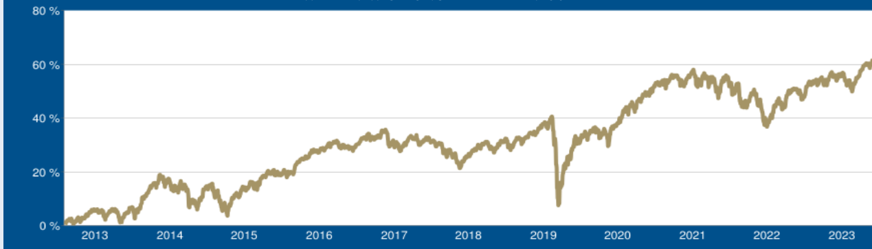
WERTENTWICKLUNG DER LETZTEN 10 JAHRE