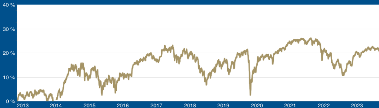
WERTENTWICKLUNG SEIT AUFLAGE