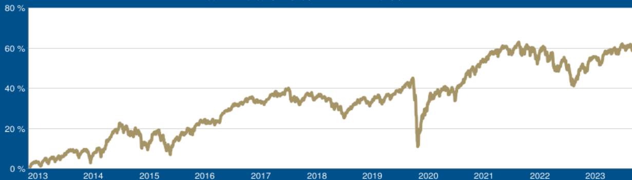
WERTENTWICKLUNG DER LETZTEN 10 JAHRE