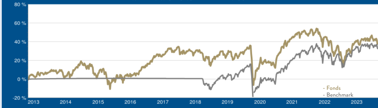
WERTENTWICKLUNG DER LETZTEN 10 JAHRE

Laufende Kosten (TER): 1,27 % per 30.09.2022