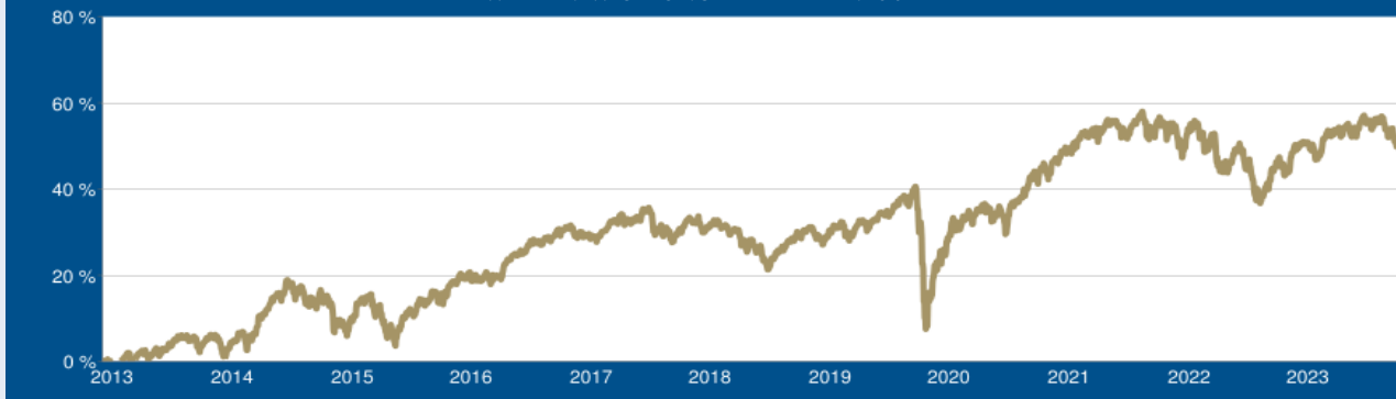
WERTENTWICKLUNG DER LETZTEN 10 JAHRE