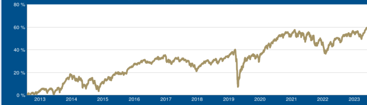
WERTENTWICKLUNG DER LETZTEN 10 JAHRE