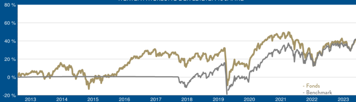
WERTENTWICKLUNG DER LETZTEN 10 JAHRE

Laufende Kosten (TER): 1,28 % per 30.09.2023