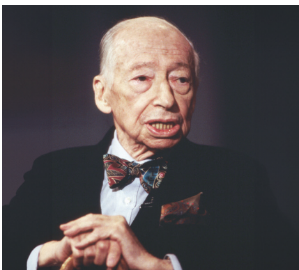
André Kostolany (1906–1999), Urvater der Börsenpsychologie wie des pointierten Aktien-Smalltalks.

Es geht, um unserem Protagonisten Kostolany zwei berühmte Nachfolger hinzuzufügen, auch um „Behavioral Finance“, das George Soros und der